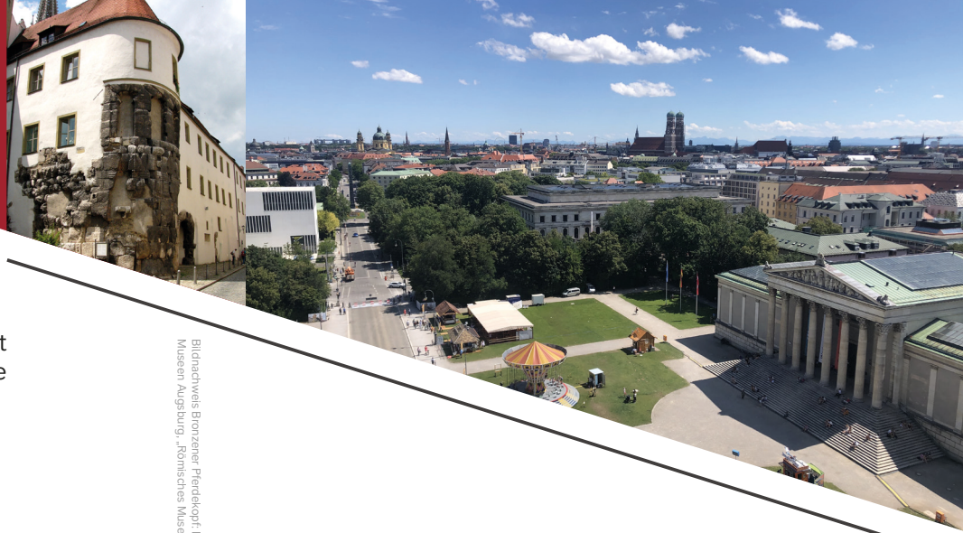
Bildnachweis Bronzener Pferdeköpfe: Kunstsammlungen und Museen Augsburg, „Römisches Museum“, InventarNr.: VF 16-4