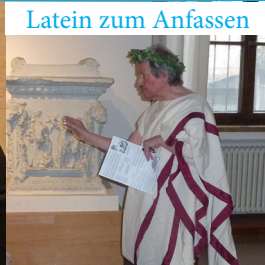
Latein zum Anfassen