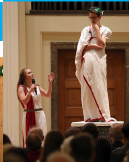
„Celebremus Ovidium“ – 2000 Jahre Ovid